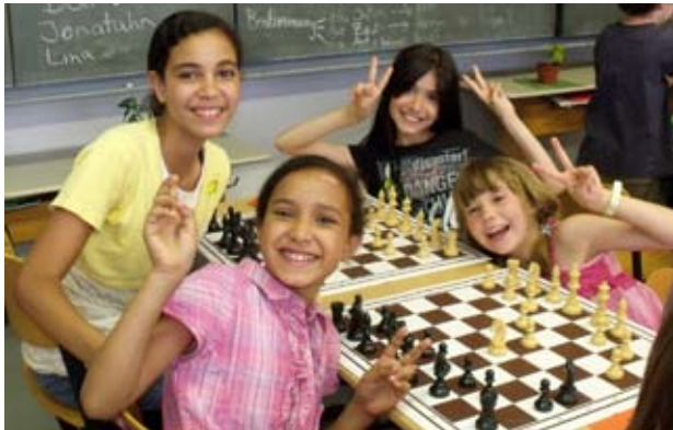
Schach fördert die Persönlichkeitsentwicklung und macht viel Spaß!